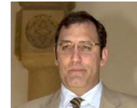
Eloy VELASCO NÚÑEZ

Auzitegi Nazionaleko Instrukzioko 6 zk.ko Epaitegi Zentraleko magistratua.