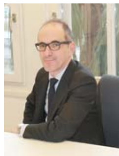
Pedro LEARRETA OLARRA

Magistratua. Auzitegi Goreneko lehendakariordea.